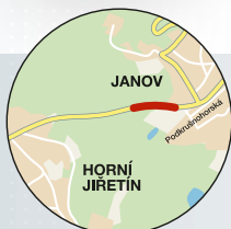
Litvínov (Ústecký kraj) úsek o délce 305 metrů na silnici III/0133 v katastru Litvínova