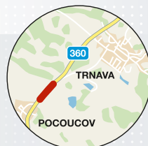
Třebíč (Vysočina) úsek o délce 186 metrů na silnici II/360 u Třebíče